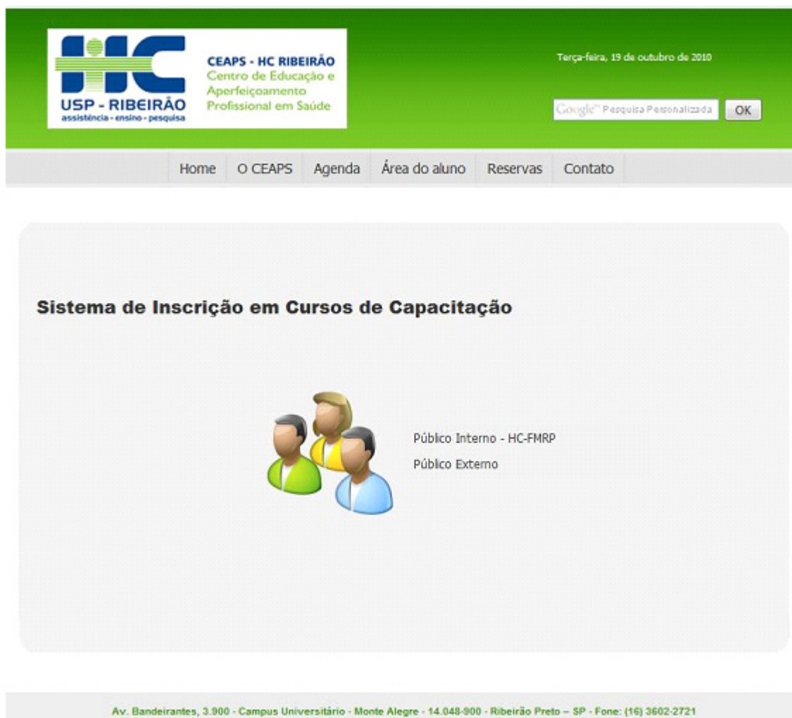
Figura 2 - Sistema de inscrição em cursos de capacitação