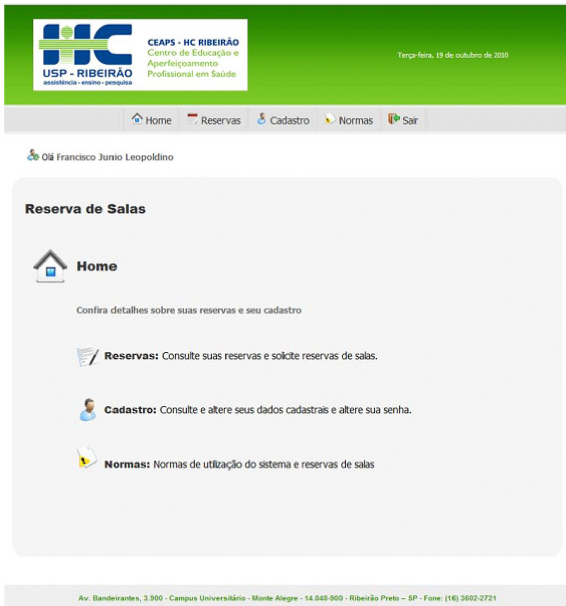
Figura 3 - Sistema de reserva de sala.