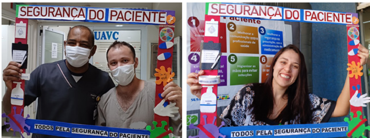
Figura 2: Foto da participação dos profissionais na ação com a moldura customizada.

Após o jogo, o participante era convidado a registrar sua imagem na moldura temática, que foi confeccionada pelo setor de marcenaria da instituição e customizada no SGR (Figura 2), aumentando o engajamento da comunidade e compartilhando a cultura de segurança do paciente. As imagens registradas e armazenadas tiveram a anuência dos participantes, que assinaram o termo. O tempo médio de participação de cada indivíduo ficou em torno de 2 a 3 minutos.