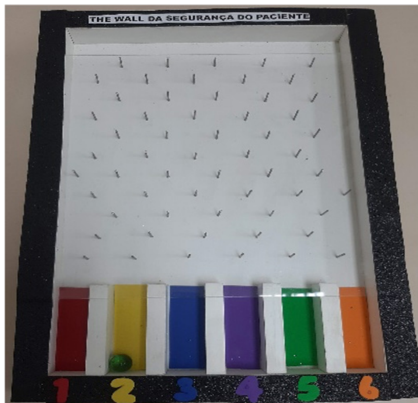
Figura 1: Jogo educativo “The Wall da Segurança do paciente”.

A ação educativa consistiu na construção de um jogo no estilo “pinball”, confeccionado pelo setor de marcenaria do próprio hospital, que reaproveitou retalhos de madeira ou materiais descartados, sendo posteriormente adornado no SGR para torná-lo mais convidativo (Figura 1).